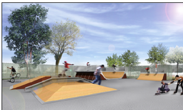
Conception Sports des Villes